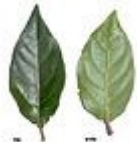
Hojas, haz y envés.

Se distribuye por la región mediterránea. En España se encuentra en Barcelona , Castellón , Gerona , Lérida , Tarragona , Islas Baleares , Valencia , Región de Murcia , Canarias , Aragón y Andalucía principalmente en maquias y bosques de encinares . Además se encuentra en las umbrías de la provincia de Cáceres : Parque nacional de Monfragüe o junto a los arroyos de montaña de los valles protegidos de la ladera sur occidental del Sistema Central como son Las Hurdes , en la misma provincia extremeña, y en los mismos hábitats en las provincias de Salamanca ( Las Batuecas ) y Badajoz . También se encuentra en jardines. Es una planta de zonas sombrías y húmedas, propia de los encinares o de zonas donde han existido estos árboles; en Mallorca sin ser rara tampoco es muy frecuente. En Menorca e Ibiza es muy rara. En Canarias se le suele encontrar en los bosques de laurisilva . En Huesca , en el Parque Natural de la Sierra y Cañones de Guara .