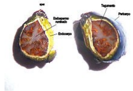
Fruto drupáceo, corte longitudinal con sus componentes