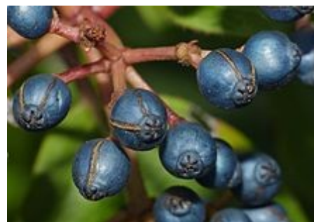
Frutos in situ.