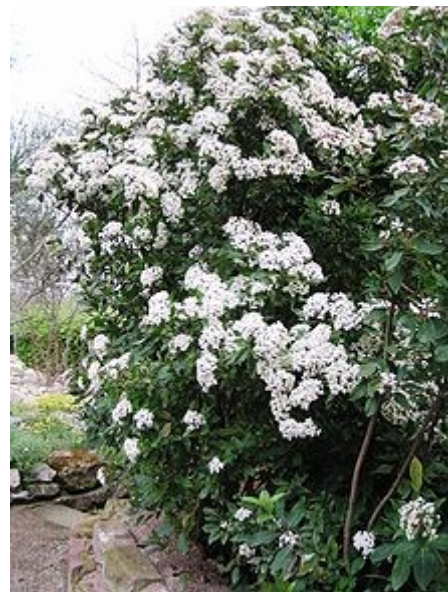
Vista general en floración.